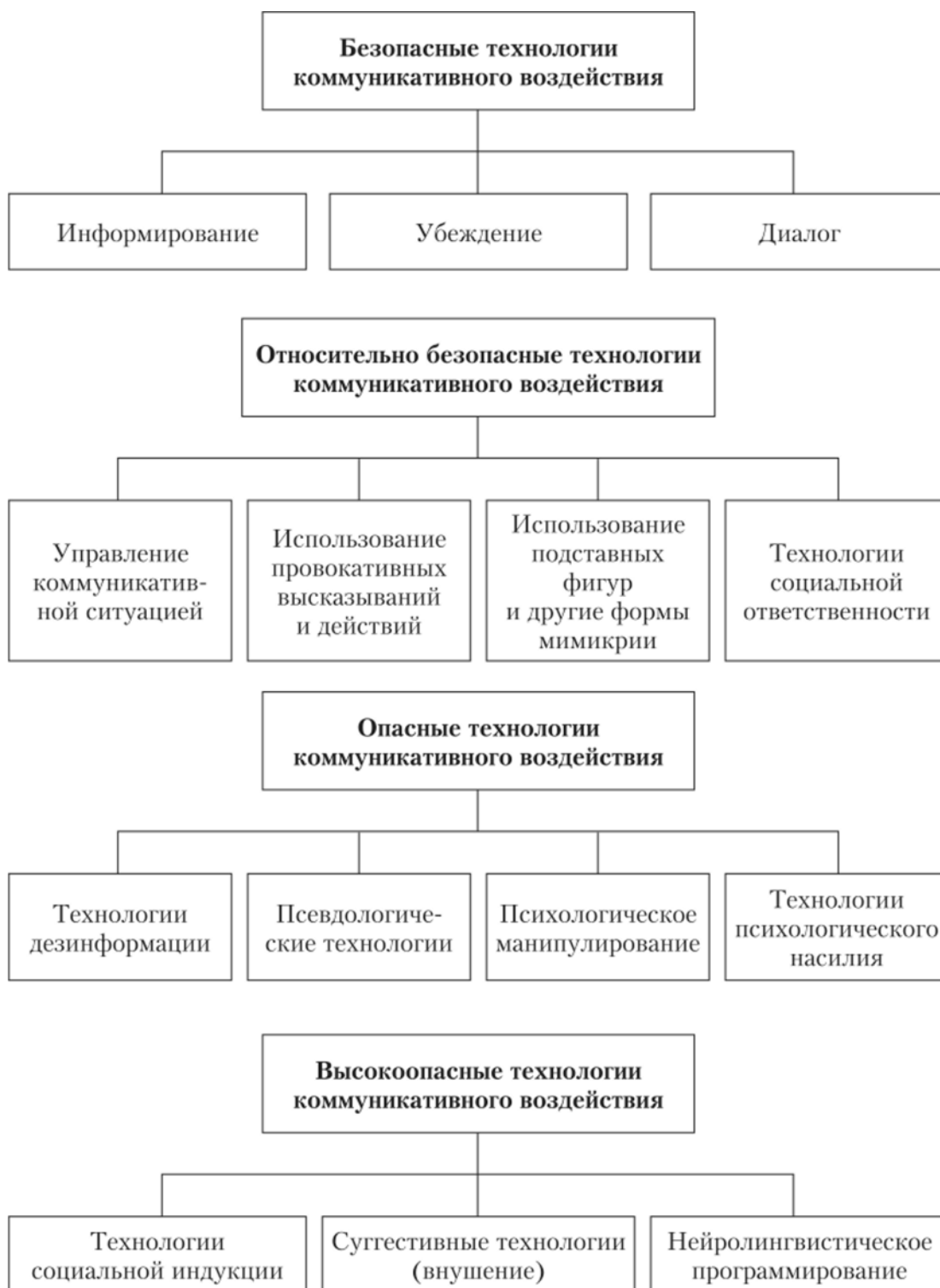
Рисунок – Технологии коммуникативного воздействия