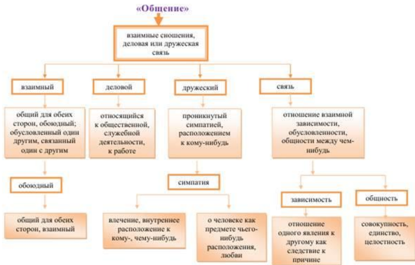
Рисунок 1 - Древо понятия «Общение»